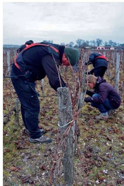
Taille en binôme dans les vignes du château Haut-Bailly

Les profils de cette première promotion sont très variés : trois chefs de culture français dont une femme, un exploitant belge, un viticulteur champenois, un vigneron des Côtes du Rhône, un viticulteur allemand, 2 chefs de culture italiens, un consultant, la responsable d'une société d'intérim... tous étaient à pied d'œuvre dans une parcelle de vigne du château Haut-Bailly le vendredi 27 janvier 2017 pour une journée de formation inscrite dans leur cursus, entre apprentissage théorique en salle et travaux pratiques dans les vignes.